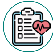
Enfermedades no transmisibles (ENT)