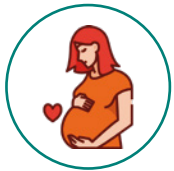
Mujeres embarazadas y lactantes

En Colombia, desde 2019 , debido a la pandemia del COVID-19, las intervenciones humanitarias se han centrado principalmente en responder a las afectaciones del virus, así como en garantizar a la población el acceso a servicios esenciales de salud. Nuestro programa se enfoca en: