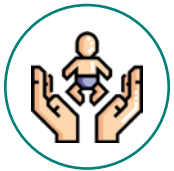
Niños/as menores de 5 años